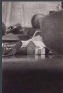
佳作 福清 美志保 《Night Flight》