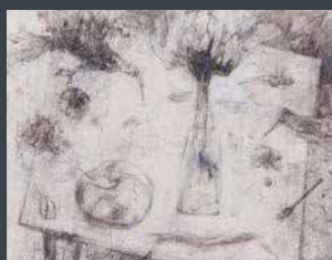
佳作 村田 哲也《純色の卓上》