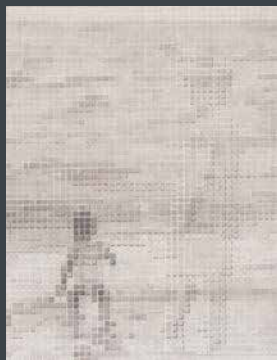
優秀賞 長谷川 正美 《I'll go back to the sea.》