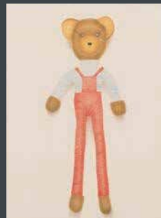
佳作 江波戸 陽子 《僕のくま》