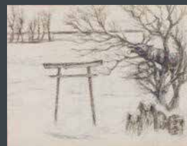
町田久美賞 山内 久 《村はずれのパラダイス》