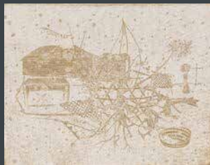
佳作 矢部 史朗 《tribosite 砂の上の足跡》