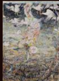
荒井良二賞 吉岡 ちえ子《とりは飛び ひとは踊る》