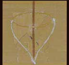
佳作 長尾 裕《雨の透き間》