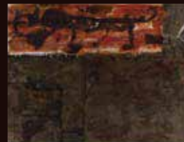
協賛特別賞 中西 徹《ユウグレ》