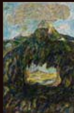
馬淵 一樹《山を眺める》 《遠景シリーズ》