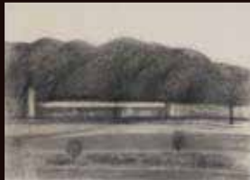
町田久美賞 久慈 伸一《川向うの街の山(地形・質量) - 阿武隈川岸》