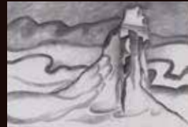
佳作 津村 侑希《混々沌々》