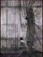
林 建杜《くらくなるまで》