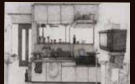
佳作 まずだ まや《「LDK 台所 午後」》