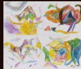
佳作 長 雪恵《4匹のらくだ》