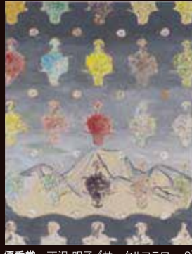
優秀賞 西沢 明子《サークルフラワー 8》