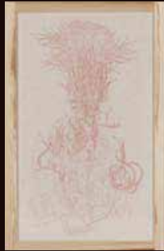
優秀賞 幸山 ひかり《花咲く虚空》